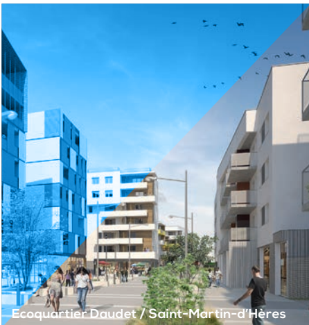
Ecoquartier Daudet / Saint-Martin-d'Hères