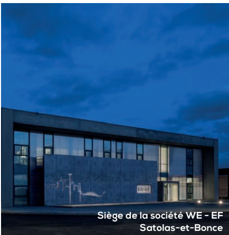
Siège de la société WE - EF Satolas-et-Bonce