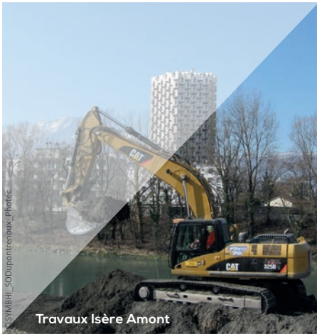
Travaux Isère Amont